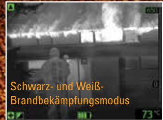
Schwarz- und Weiß-Brandbekämpfungsmodus

Für Erstmaßnahmen zur Brandbekämpfung und Lebensrettung.