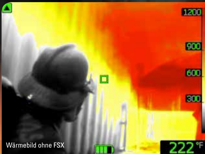
Wärmebild ohne FSX