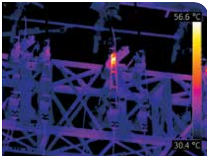
Überhitzender Trennschalter in einem Umspannwerk